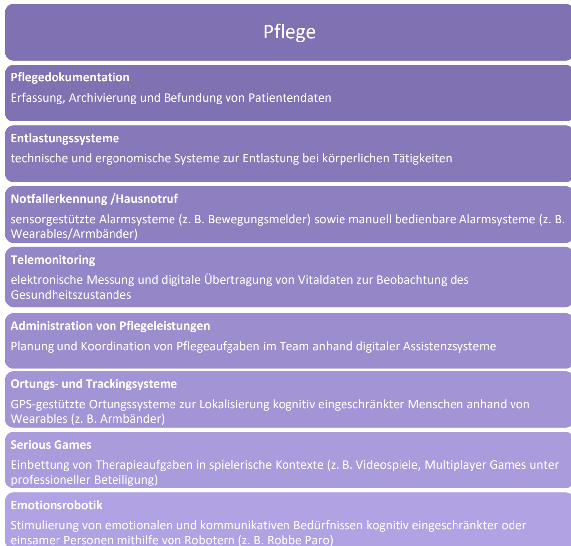
Abbildung 1: Anwendungsbeispiele digitaler Systeme in der Pflege